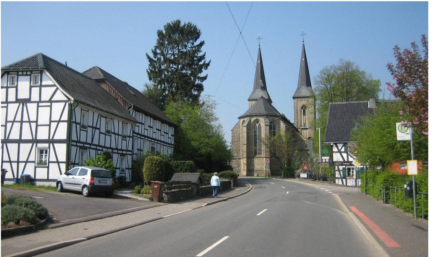
Marialinden ist ein lang gestrecktes Straßendorf. Wenn man von Overath kommend an der Kirche vorbei fährt/geht (Blick zurück), liegt links im Bild der Friedhof mit dem Grab von Bernhard Linnenkohl.