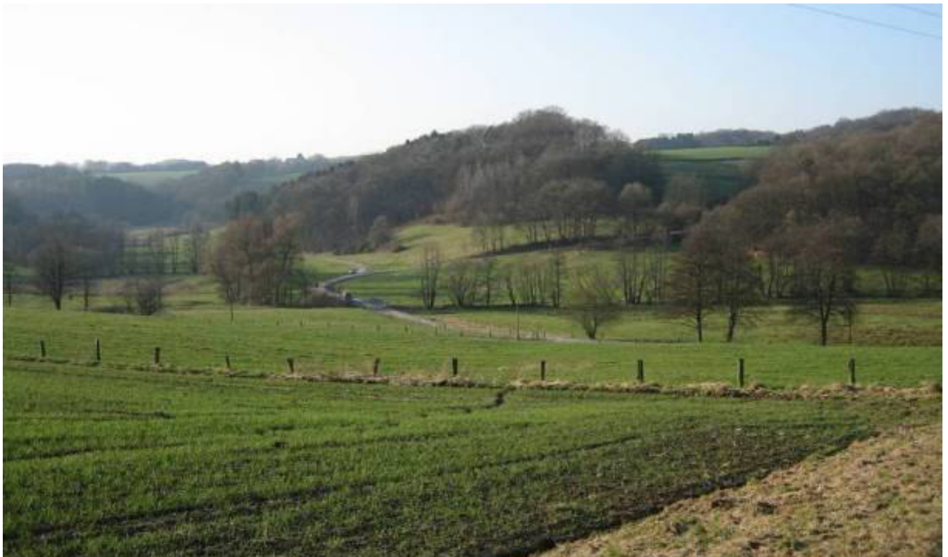
Wenn man vom Kreisel auf der Höhe geradeaus abwärts fährt, kommt man hinunter ins Naafbachtal. Nach rechts-oben im Bild auf der halben Höhe liegen die Weiler Halzemich und ehemals Büchel (hinter dem Wald).

(Verfasst von Helmut Wurm, Betzdorf, im Sommer 2013; alle Fotos vom Verfasser)