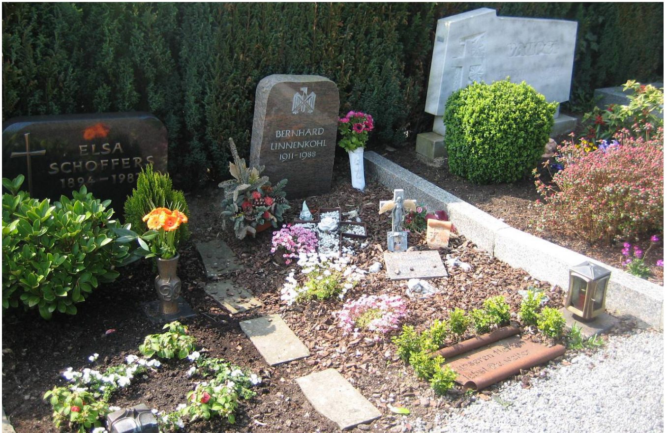
... etwa in der Mitte der Gräberzeile.